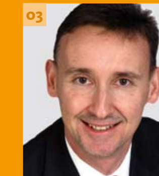
03 Gerhard Feeß Simmersfeld 44 Jahre, verheiratet, 2 Kinder Bürgermeister der Stadt Altensteig